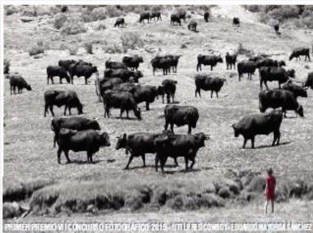
PRIMER PREMIO VII CONCURSO FOTOGRAFICO 2015 - TITLED:RED COMBOY - EDUARDO MARTIN RAMIREZ